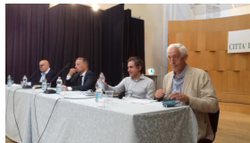
Chiavari: presentato il romanzo su Albino Badinelli